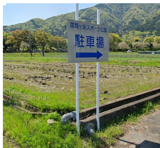
こちらの看板を右折してください